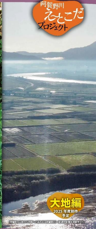
大地編 2025年度制作 予定