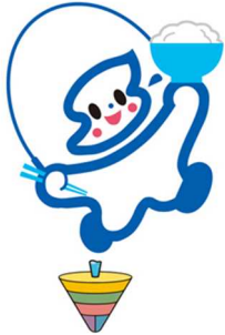
食育普及マーク「ショクビィー」