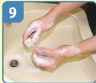
つめブラシ(5回ずつ)