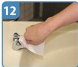
蛇口栓にペーパータオルをかぶせて栓を締める