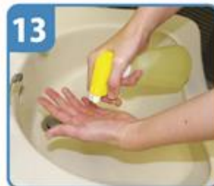
アルコールを噴霧して手指にすり込む