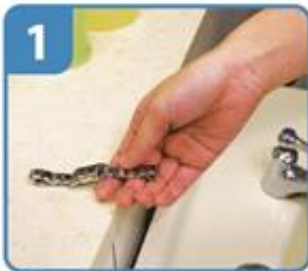
時計や指輪をはずし