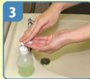
手洗い石けんをつけて