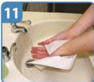
ペーパータオルでふく