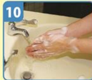
水で十分にすすぎ