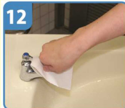
蛇口栓にペーパータオルをかぶせて栓を締める