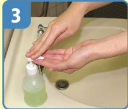
手洗い石けんをつける