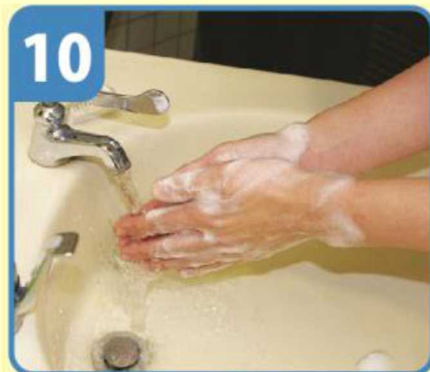
水で十分にすすぐ