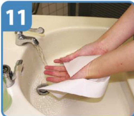
ペーパータオルでふく