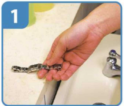
時計や指輪をはずす