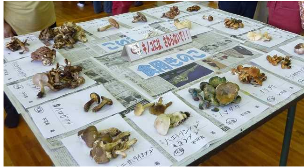
南魚沼会場（八海山麓サイクリングターミナル）の様子