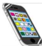
ホームページやメルマガによる情報発信