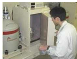
食品検査（放射性物質、添加物等）