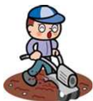
環境保全型農業の推進