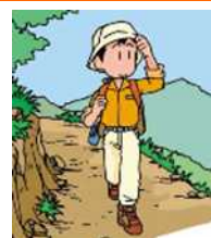
食の安全・安心サポーターの設置