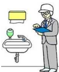
飲食店や食料品店への監視