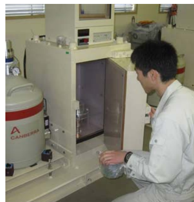
ゲルマニウム半導体検出器