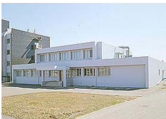
県放射線監視センター