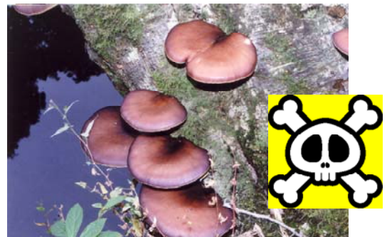
毒きのこの代表 ツキヨタケ