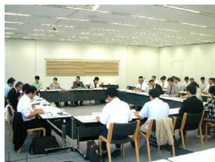
にいがた食の安全・安心審議会

実施状況は、「にいがた食の安全・安心審議会」の点検を受けるとともに毎年度公表し、県民のみなさまの意見を求めながら必要に応じ実施方法等を見直していきます。