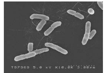
腸管出血性大腸菌 O157